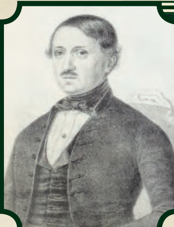
Bugát Pál, a Természettudományi Társulat első elnöke (1841–1843)